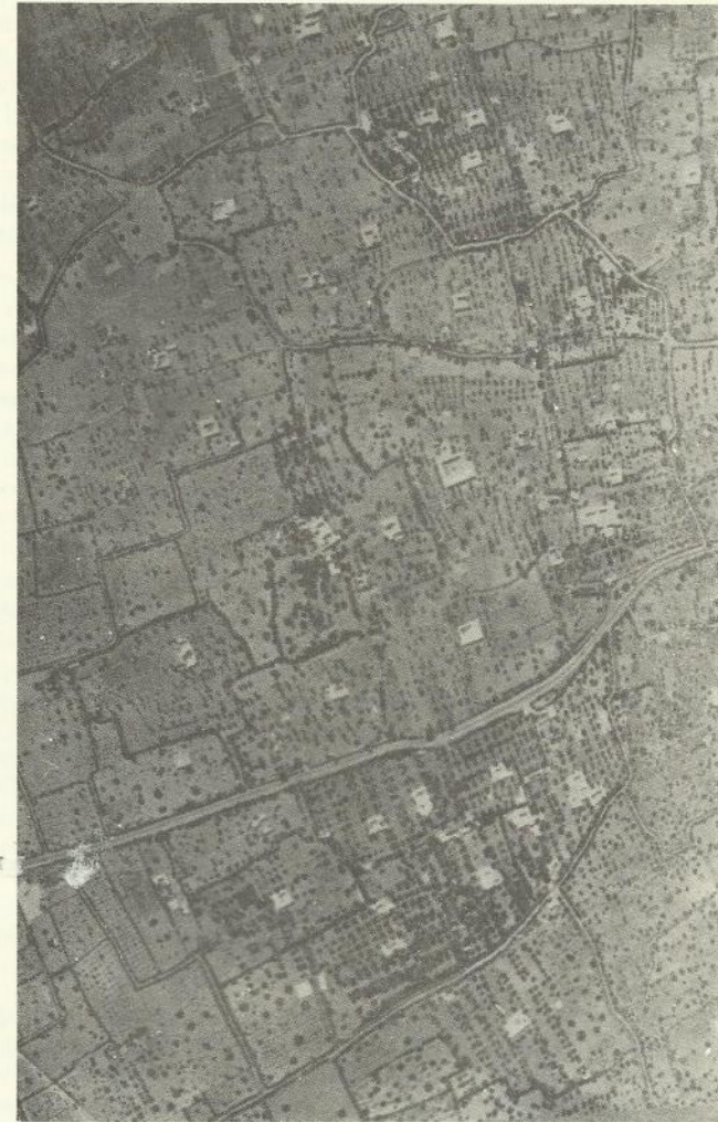
— Vue aérienne de la région de Midoun montrant la dispersion de l'habitat et le morcellement foncier. Les menzels, à la forme carrée autour d'une cour centrale est apparente, ne sont jamais alignés en bordure des chemins.

Sans elle on ne pourrait comprendre ni le morcellement foncier qui a pulvérisé la propriété au fur et à mesure de la progression démographique, ni la conception autarcique de l'économie, chaque